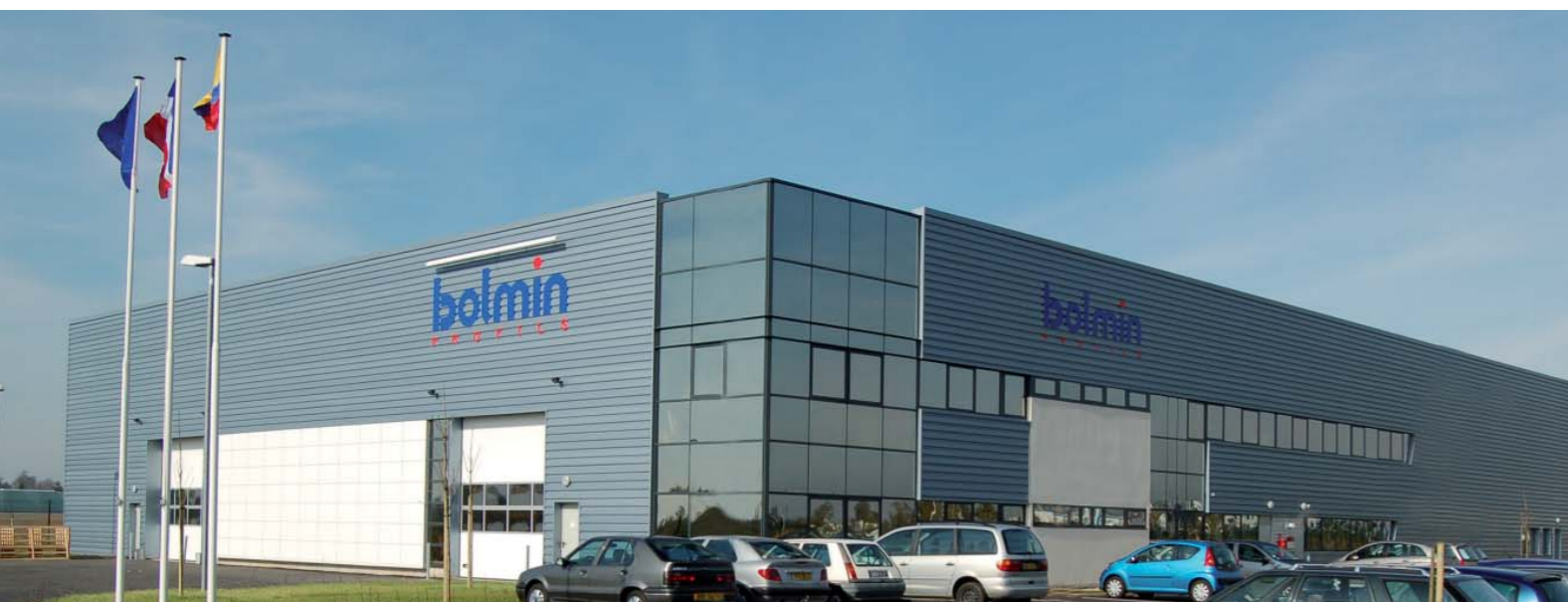
RÉALISATIONS : COUVERTURE, 2,7 ALLURE & AMÉNAGEMENTS - 3,4,8 CREATIFLEX - 5 AOS - 6 TETRIS